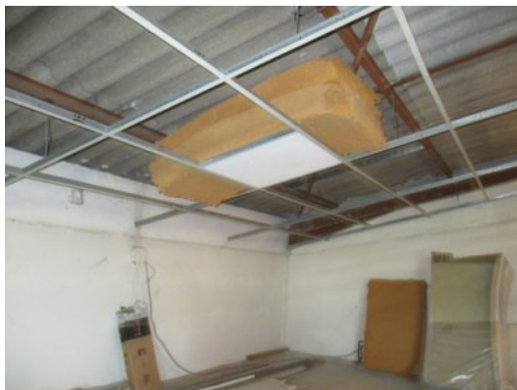
photo 1 - Isolation du toit

L'opération isolation consistait à mettre sur la structure métallique du faux-plafond composée d'entretoises, des plaques en fibrociment ou de laine de roche compressées (60 x 60) + des plaques de laine de bois compressées (2 cm d'épaisseur) + deux couches d'isolants en laine de bois (12 et 14 cm d'épaisseur) (photos 1). La poussière de bois envahissant l'espace, il fallait travailler en permanence avec des masques.