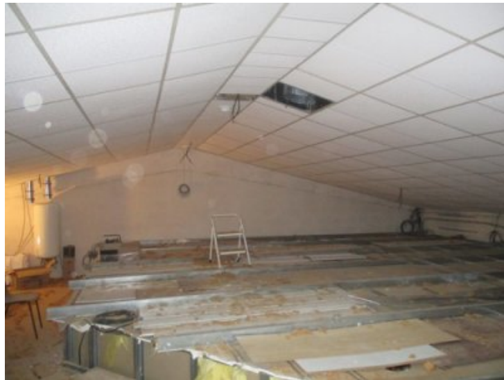
photo 9 : Isolation toit terminée. Au centre une sortie cheminée a été prévue pour l'installation éventuelle d'un poêle à bois.