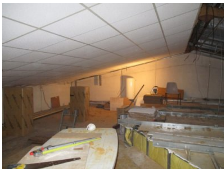
photo 4 - partie gauche du toit terminée