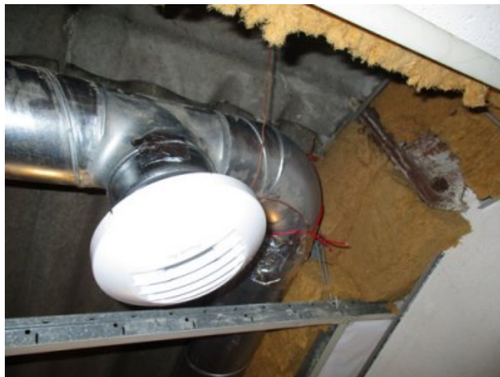
photo 2 - Réseau VMC

Opération isolation du toit (surface de 130 m 2 ), intégration dans l'isolation du réseau électrique (câbles,) et pour une bonne conservation des documents du système de ventilation du local avec sortie toiture (WC, Cuisine, VMC) (voir photo 2)