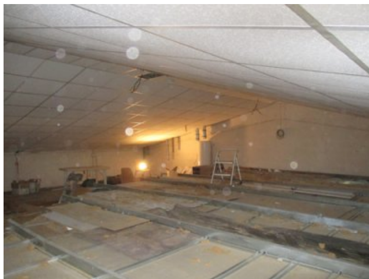
photo 10 : Au fond à gauche les tuyaux (aération et ventilation) pour la sortie en toiture.