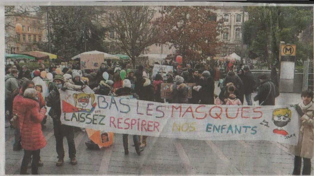
Une centaine de personnes s'est rassemblée près du Capitole, hier matin./DDM, Michel Viala.

DITES NON A L'OBLIGATION DU MASQUE DANS TOUS LES ETABLISSEMENTS SCOLAIRES AVEC TOUS LES COLLECTIFS DE PARENTS OCCITANIE MOBILISONS NOUS POUR NOS ENFANTS