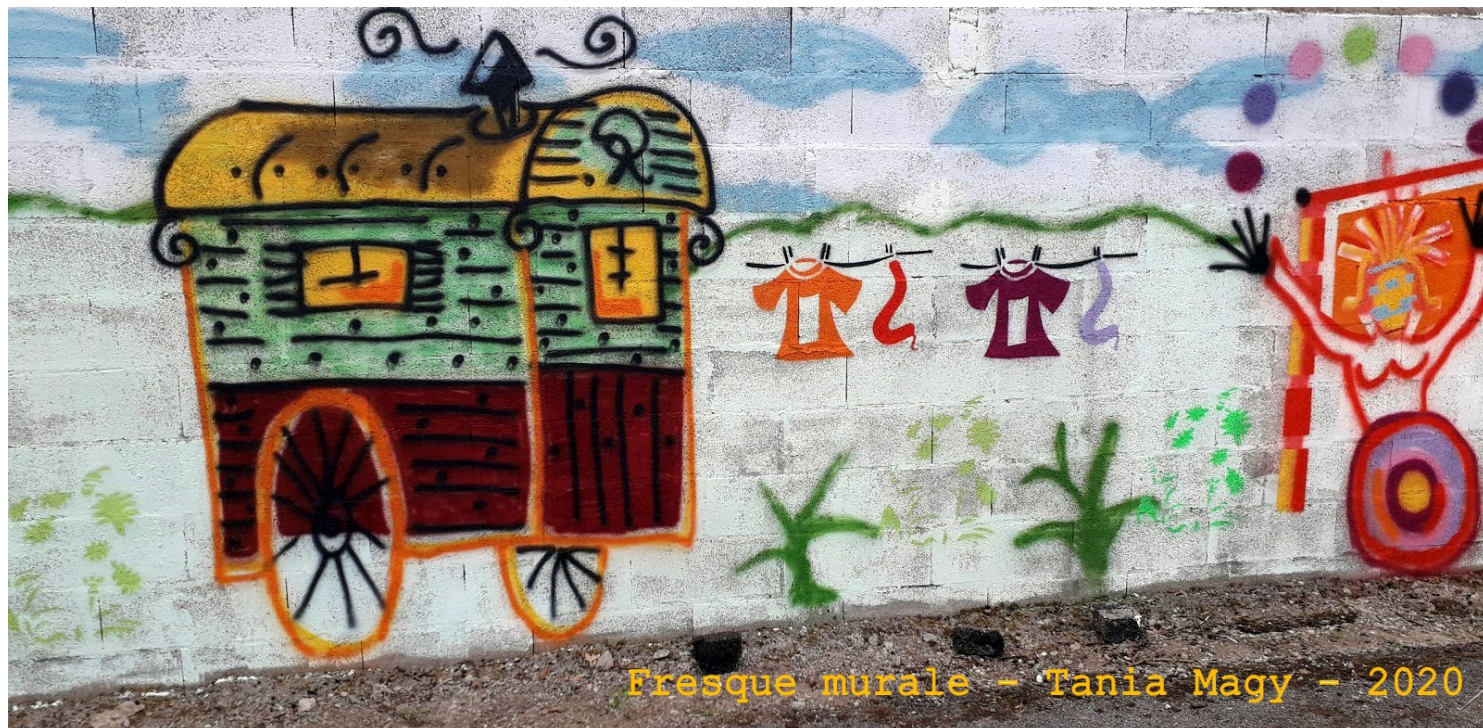
Fresque murale - Tania Magy - 2020