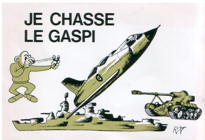
Autocollant de 1980 - Dossier Armée