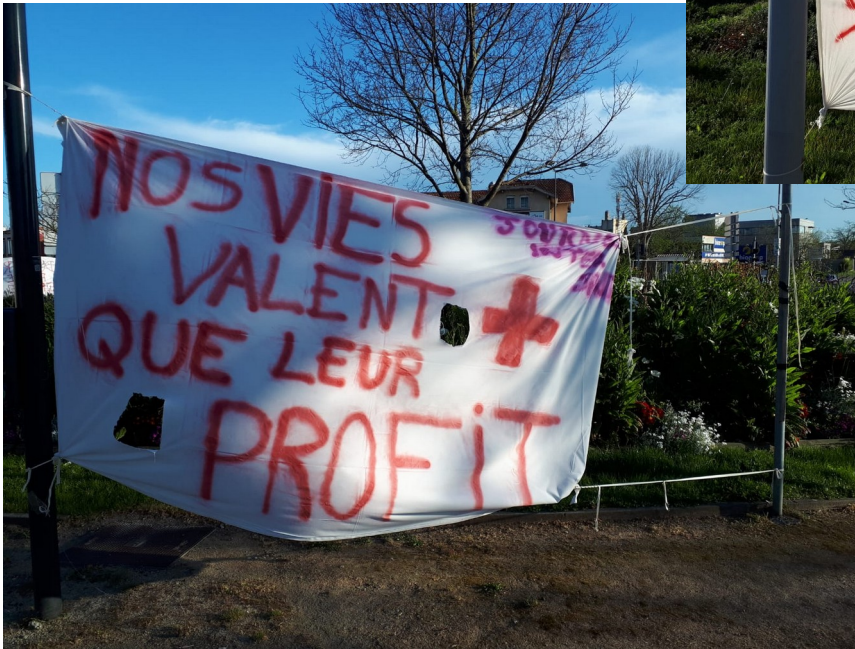
Toulouse - 8 avril 2020